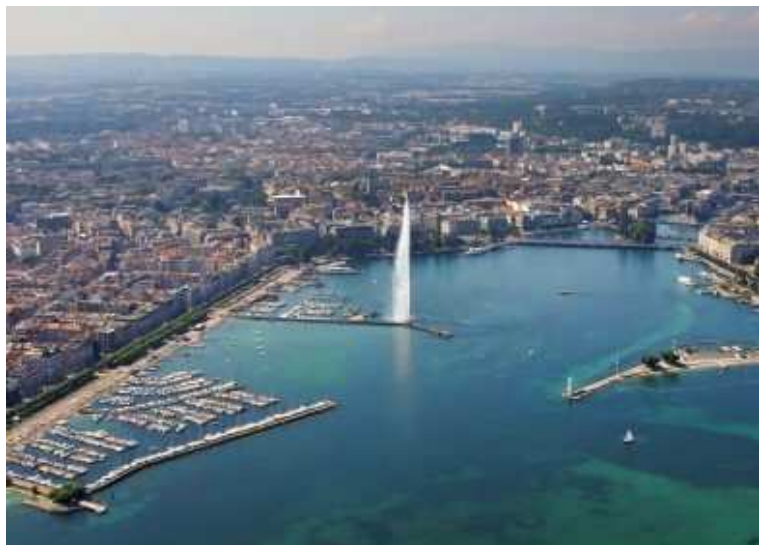
Genf und der Lac Léman gelten als Frühindikator: Der Immobilienmarkt 2017 stabilisiert sich hier.

Immobilienmarkt 2017: Auch im neuen Jahr bleibt die Neubautätigkeit hoch – es gibt ein attraktives Angebot an Neubauten.